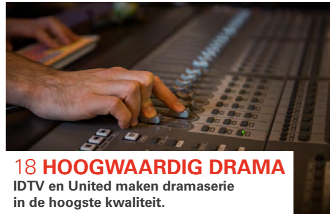
18 HOOGWAARDIG DRAMA IDTV en United maken dramaserie in de hoogste kwaliteit.