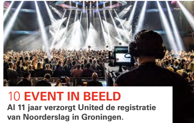
10 EVENT IN BEELD Al 11 jaar verzorgt United de registratie van Noorderslag in Groningen.