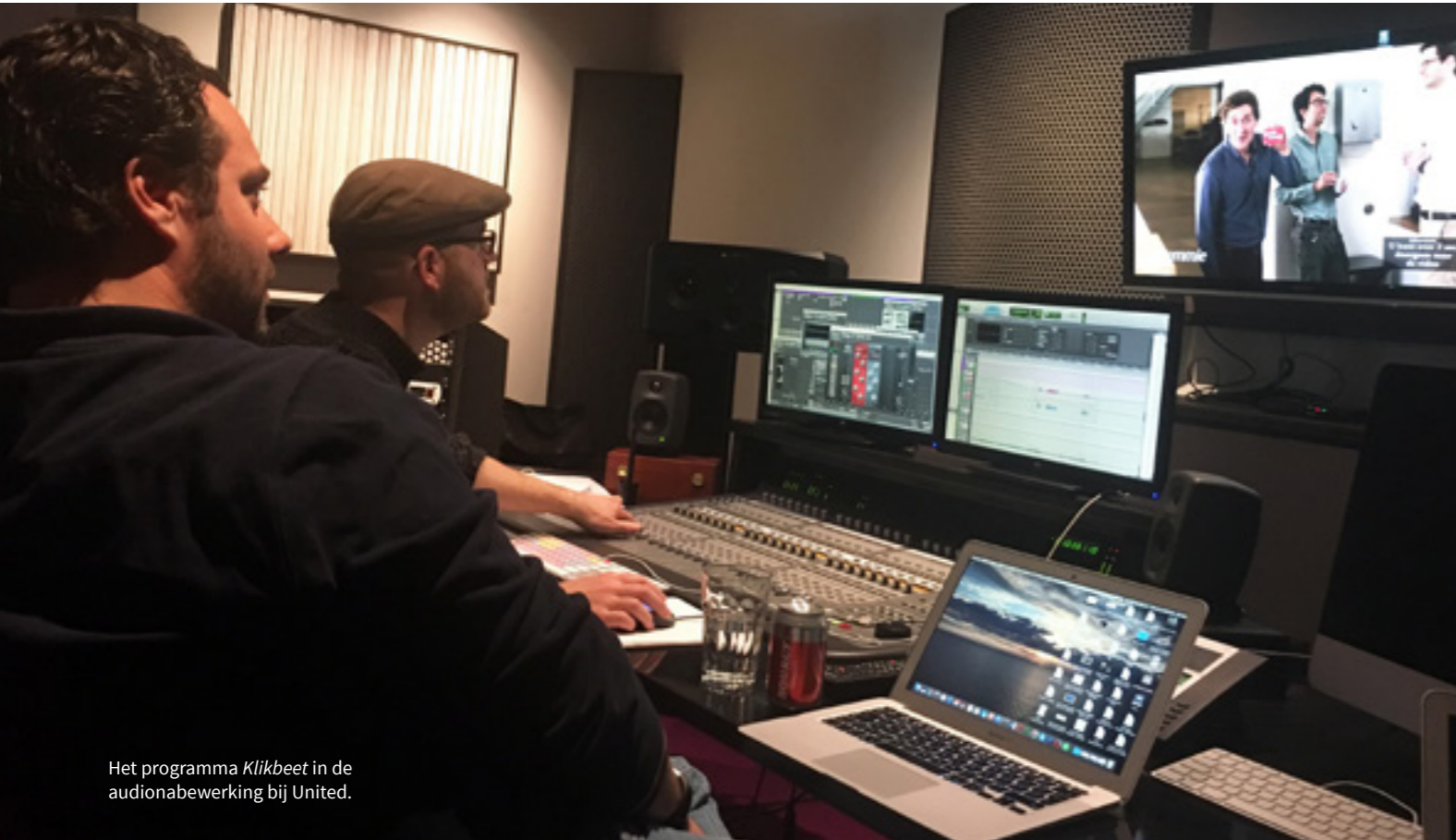
Het programma Klikbeet in de audionabewerking bij United.